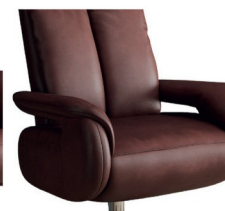
Armlehne 3 (gegen Aufpreis)