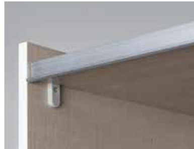
Führungsschienen aus Metall, Schwebetürendämpfer optional