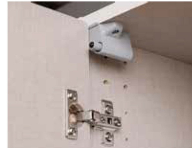
Topfbänder aus Metall, Drehtürendämpfer optional