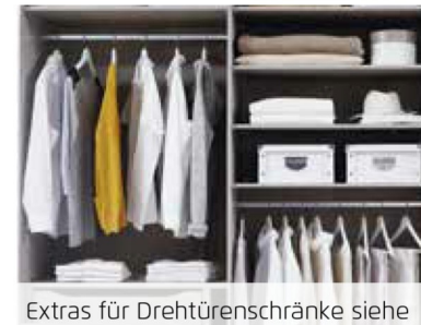
Extras für Drehtüreschränke siehe BLUE Zubehör 2.0 / Extras für Schwebetüreschränke finden Sie nach den Schränken.