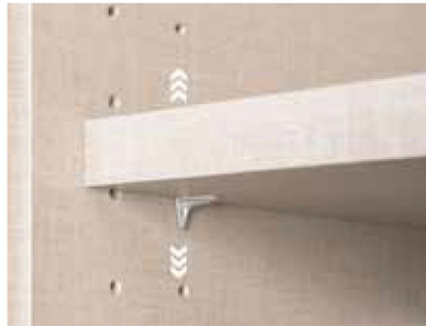
Fachböden 16 mm stark