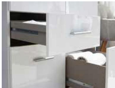
Schubkästen mit kugelgelagerten, leisen Laufschienen