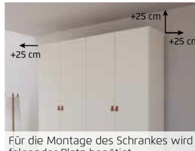
Für die Montage des Schrankes wird folgender Platz benötigt: Schrankhöhe + mind. 25 cm, Schrankbreite + mind. je 25 cm an beiden Seiten.