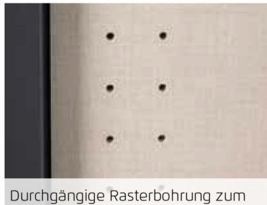
Durchgängige Rasterbohrung zum flexiblen Anordnen von Kleiderstange und Fachböden