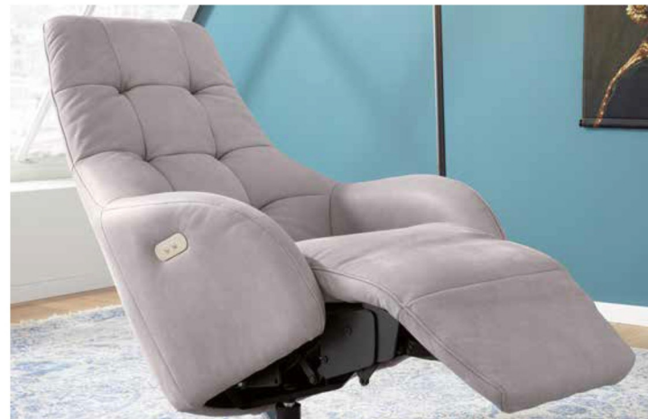
Bezug: Z78/21 steel