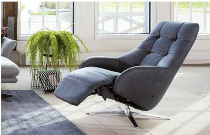
Bezug: Z78/28 navy