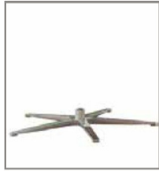
5-Sternfuß versch. Metallfarben - SX F 99