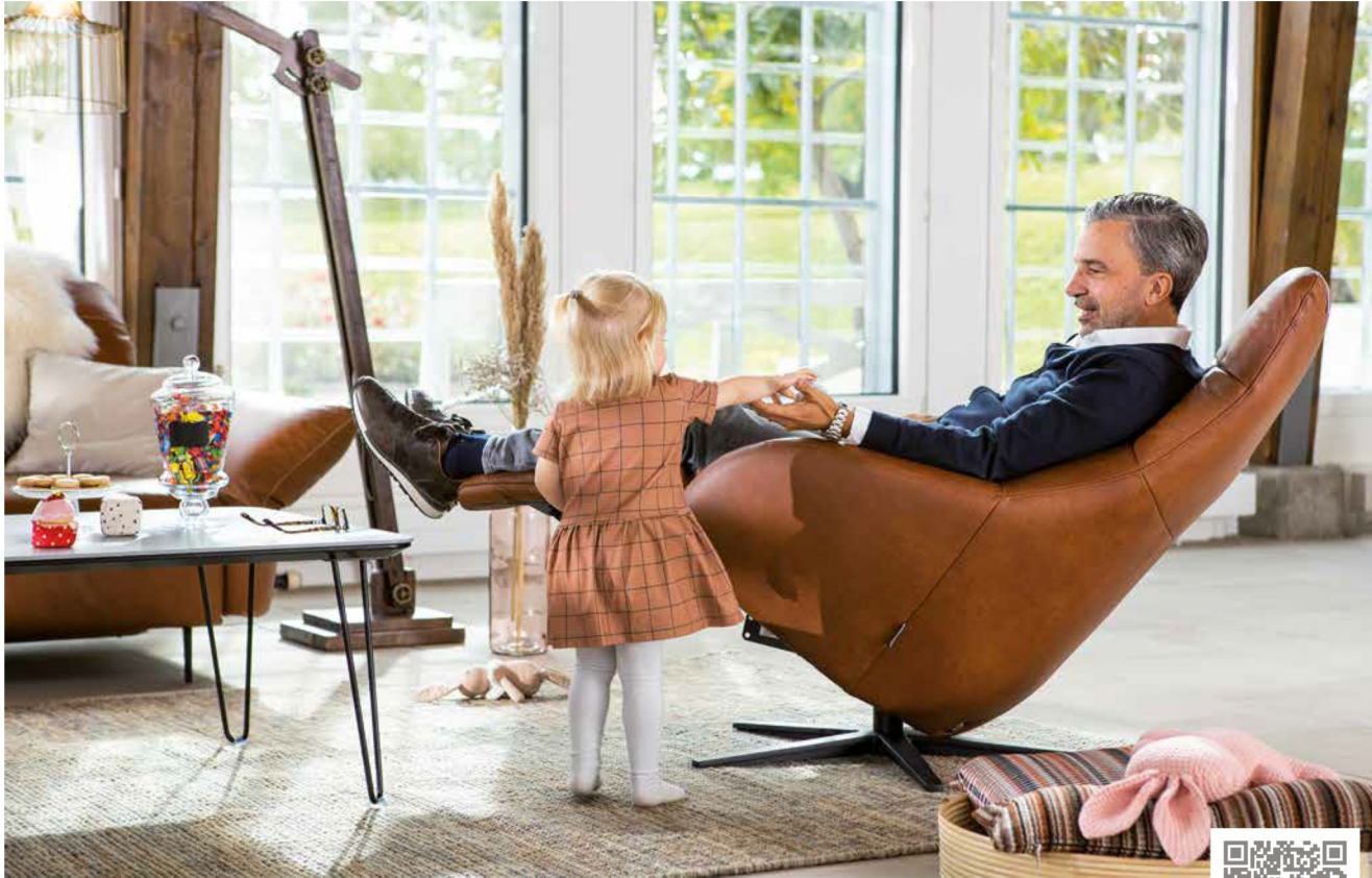
Bezug: Z69/50 cognac