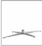
4-Sternfuß, Mehrpreis nickel-satiniert - SF F 1D