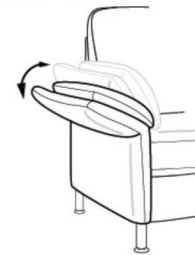
Armlehne A mit Liegearmlehne gegen Aufpreis