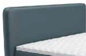
0383 Höhe 116 cm