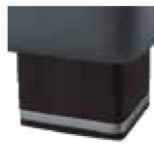
H05-10 H05-15 Holzfuß wengefarbig