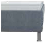
glatt Höhe ca. 29 cm