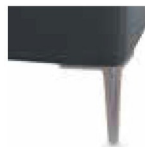
A11-10/M12 A11-15/M12 Alufuß gebürstet