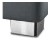
M09-10 M09-15 Metallfuß verchromt