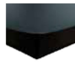
S01-10 S01-15 Bettsockel schwarz