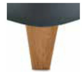
H25-10 H25-15 Holzfuß Eiche natur geölt