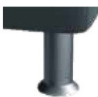
K01-10 K01-15 Kunststofffuß alufarbig