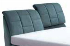
0864KV Höhe 110-124 cm nur lieferbar bei Bett- größen 160-200cm Breite