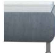
leicht bombiert Höhe ca. 35 cm