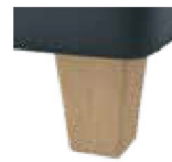
H17-10 H17-15 Holzfuß Buche natur lackiert