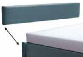
Kopfteilblende 3029 - Höhe 29 cm 3035 - Höhe 35 cm