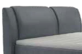
0327 Höhe 108 cm