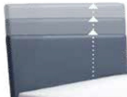
0300 Multimaß Höhe 70 - 125 cm in 5 cm-Schritten kürzbar