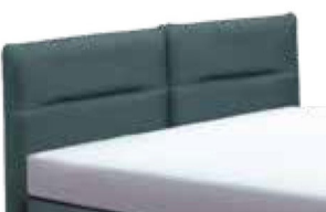
24020 Höhe 115 cm