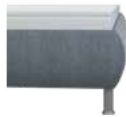
leicht bombiert Höhe ca. 29 cm