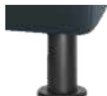
M24-10 M24-15 Metallfuß schwarz