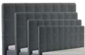
0046S - Höhe 99 cm 0046M - Höhe 109 cm 0046L - Höhe 119 cm 0046XL - Höhe 129 cm