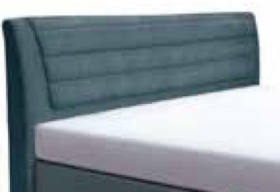
0863 Höhe 109 cm