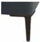
A11-10/M01 A11-15/M01 Alufuß schwarz matt