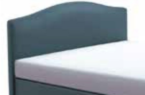
0334 Höhe 106 cm