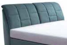
0864 Höhe 110 cm nur lieferbar bei Bett- größen 160-200cm Breite