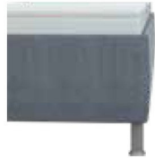
glatt Höhe ca. 35 cm