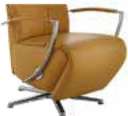
Armteil 4 gegen Aufpreis