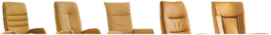
Rücken 1 Rücken 2 Rücken 3 Rücken 4 Rücken 5